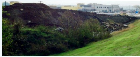
INACCEPTABLE, no aprobada. Material apilado contra el dique

El Cuerpo del Ejército de EE. UU. y el Condado de Yakima pueden hacer ciertas excepciones a esta regla, siempre y cuando la invasión no afecte la operación, el mantenimiento, o la integridad estructural del dique.