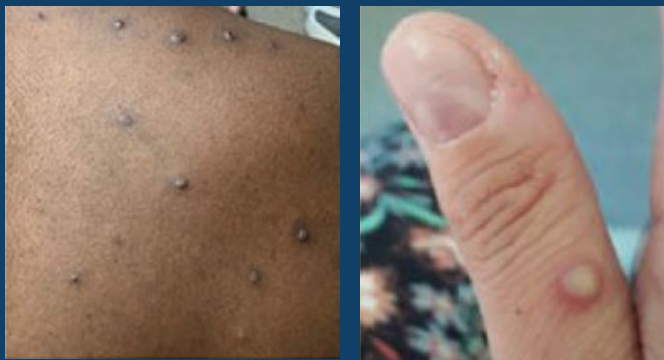
Ejemplos visuales de sarpullido de viruela del simio

Una persona es infecciosa desde el momento en que comienzan los síntomas hasta que la erupción se cura por completo y se forma una nueva capa de piel. Esto puede llevar de 2 a 4 semanas.